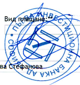
Схема за подпис: А